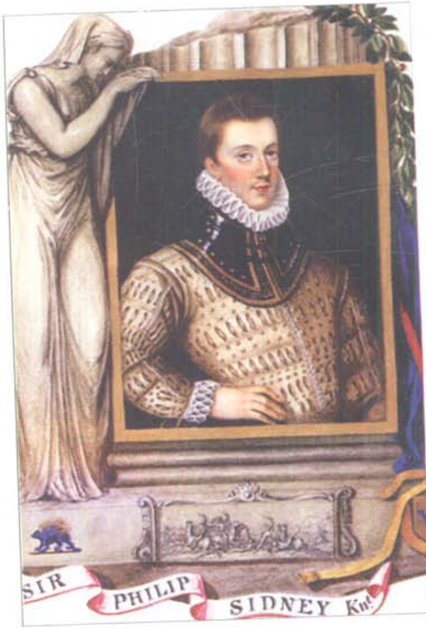
سرفلپ سڈنی (Sir Philip Sidny)