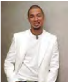
Marcell Siahaan

Bahkan, dia mengambil dua film sekaligus. Yakni Laskar Pemimpi yang tayang di bioskop mulai 30 September lalu dan Madame X yang baru dirilis. “Saya belajar main film dan mencoba