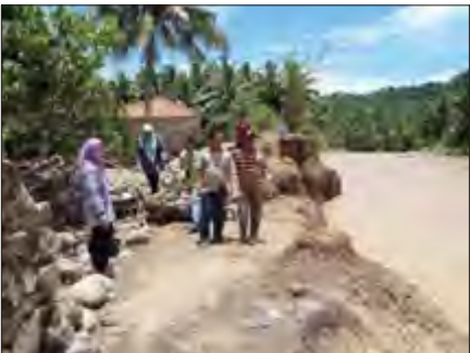
Sekcam Punduhpidada Daryoso saat menunjukkan kerusakan yang disebabkan banjir.