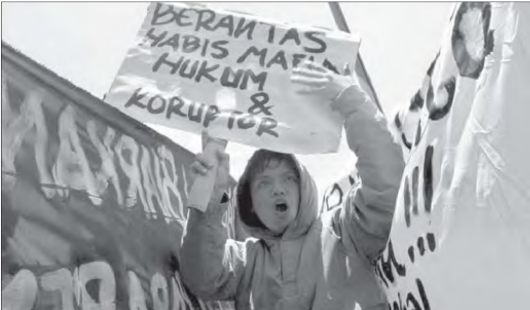
RAKYAT MENGUGAT: Puluhan aktivis menggelar unjuk raksa di depan Istana Presiden, Jakarta, kemarin (10/10). Para demonstran menuntut pemerintah bertanggung jawab sekaligus mencari jalan keluar atas kejadian bencana alam akhir-akhir ini.