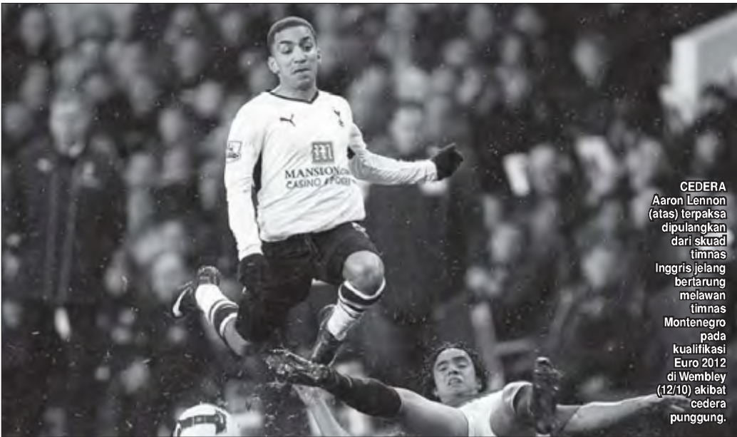
CEDERA Aaron Lennon (atas) terpaksa dipulangkan dari skuad timnas Inggris jelang bertarung melawan timnas Montenegro pada kualifikasi Euro 2012 di Wembley (12/10) akibat cedera punggung.

Bila melihat dari performa di level klub, Johnson punya peluang turun lapangan sebagai starter melawan Montenegro. Itu tidak lepas dari performa mengkilapnya bersama Manchester City pada awal musim ini. Selain itu, dia juga tampil bagus di timnas.