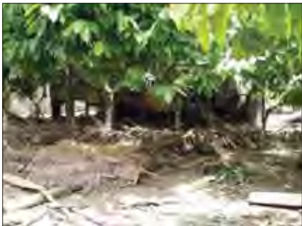
Kerusakan akibat banjir.