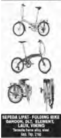
SEPEDA LIPAT- FOLDING BIKE BAROK, S/LT, ELEMENT, LAUK, VIKING Tersedia harga diski, siap dik. Tlp. 2746

Jl. Kartini No. 174 (Telkom) Telp. 262842 Bantenlampung Email: hambaryaja@yahoo.com