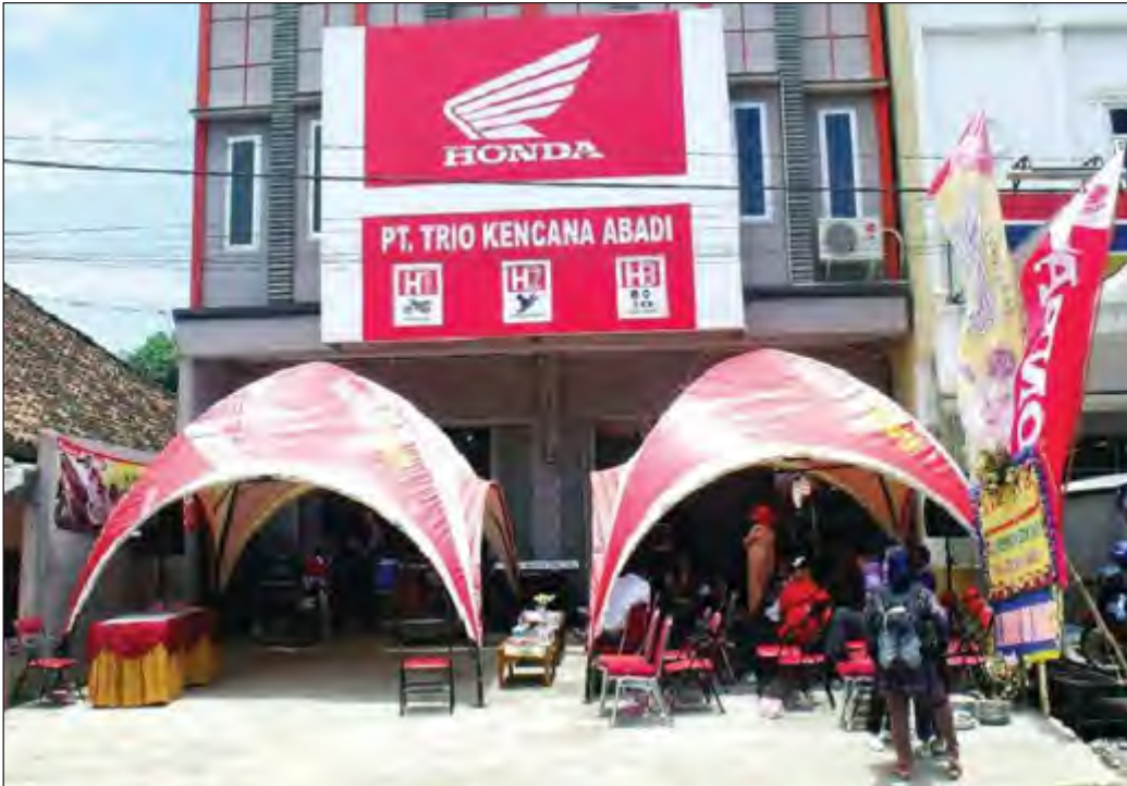
RESMI BEROPERASI: Setelah resmi membuka layanannya pada Sabtu (9/10), Trio Kencana Abadi menargetkan penjualan 220 unit per bulan.