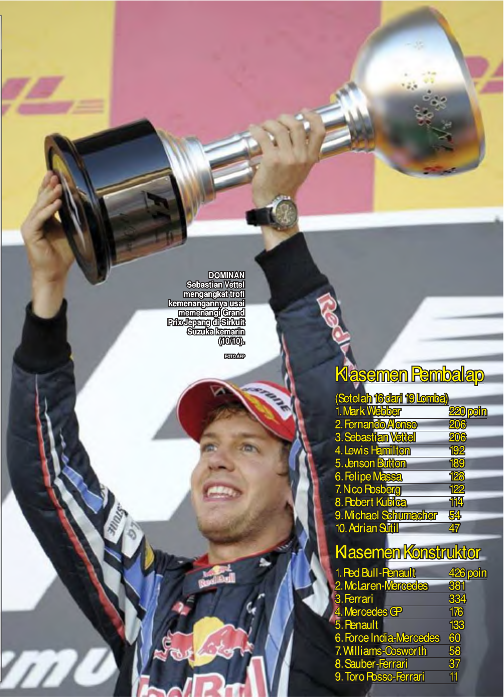
DOMINAN Sebastian Vettel mengangkat trofi kemenangannya usai memenangi Grand Prix Jepang di Sirkuit Suzuka kemarin (10/10).

Sementara Webber dan Vettel berebut gelar pembalap, Red Bull mungkin sudah bisa menyiapkan tempat untuk memajang trofi konstruktor. Dengan hasil kemarin, tim itu telah mengumpulkan total 426 poin, 45 lebih banyak dari pesaing terdekat, McLaren-Mercedes. (jpnn/ade)