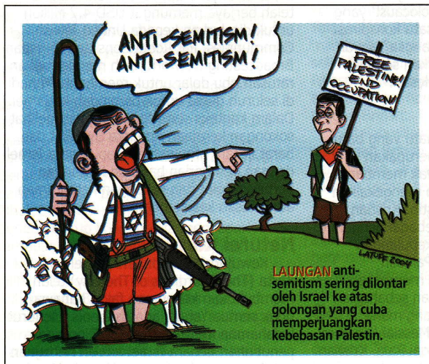
LAUGAN anti-semitism sering dilontar oleh Israel ke atas golongan yang cuba memperjuangkan kebebasan Palestin.

Antara perbezaan yang ketara di antara Neturei Karta dengan golongan Zionis adalah sikap mereka terhadap isu negara Israel di Palestin. Kumpulan Neturei Karta sama sekali menentang pembinaan negara Israel (Erez Yizrael) kerana beranggapan bahawa ini hak Tuhan mereka untuk menentukannya, apatah lagi pembinaan negara Erez Yizrael menumpahkan banyak darah serta mengambil hak orang lain. Mereka sebenarnya yakin terhadap kedatangan 'Messiah' yang telah dijanjikan Tuhan untuk pulang bersama ke Palestin dan hidup aman dan harmoni dengan penduduk lain dalam keadaan beriman kepada Tuhan. Sesuatu yang menarik untuk dikongsi bersama, terdapat kisah 'Messiah' dalam versi agama Kristian, Yahudi dan juga Islam, namun apakah kebenaran di sebalik cerita 'Messiah' ini dari sudut Islam?