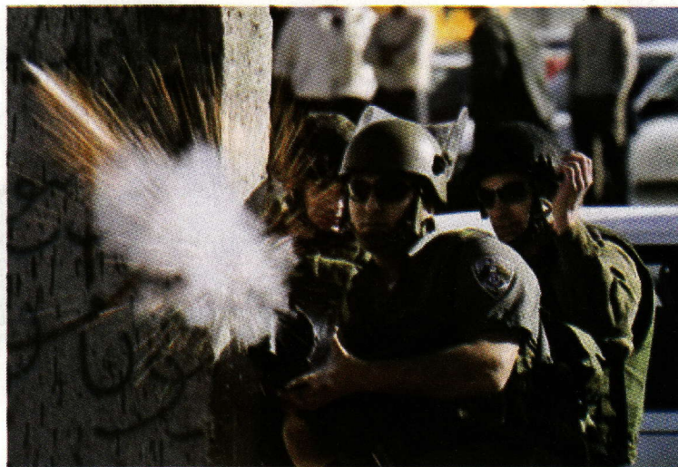
ASKAR Israel dilihat sangat sombong apabila mendepani penduduk Palestin yang serba kekurangan dari segi senjata.

Sesuatu yang menarik untuk dikongsi, kumpulan ini bukan hanya tidak mengiktiraf gerakan Zionis, mereka banyak mengeluarkan kenyataan-kenyataan yang menyatakan kerelaan mereka untuk bernaung di bawah kerajaan Islam berbanding di bawah pemerintahan Zionis. Kenyataan ini dibuat di dalam akhbar-akhbar mereka sejak dari tahun 1944 lagi. Mereka juga sering kali mengeluarkan kenyataan-kenyataan mengutuk kerajaan Israel dan sering kali menggantung bendera Israel separa tiang apabila tiba hari sambutan kebangsaan penubuhan negara Israel yang dilakukan pada setiap tahun.