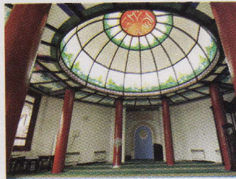
Keunikan Masjid Beijing menggamit Pelancong ms 65 & 66