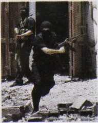
Ancaman Gerakan Zionis ms 59 & 62